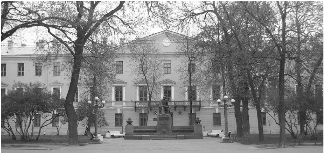
Nikolain ratsuväkikoulu Pietarissa